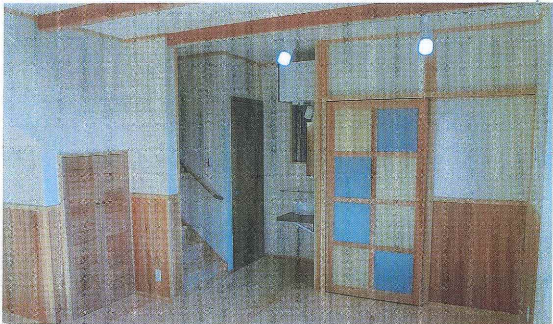
お喜び下さっている居室内です。