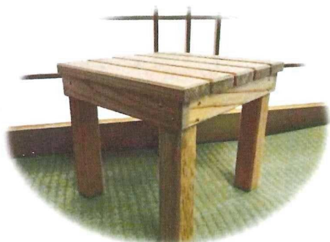
サイズ：約 24.2×24.8 高さ 21.7 cm