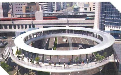
四日市市役所ホームページ引用